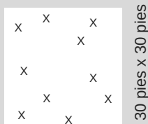
30 pies x 30 pies

En este ejemplo, se requeriría una muestra separada para cada área. Para cada muestra, tomaría tierra de 10 a 12 puntos y la mezclaría. Se presentarían dos pruebas.